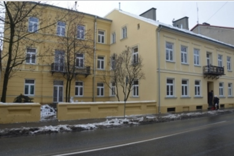
ul. Wojska Polskiego 32