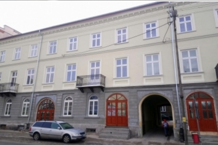
ul. Wojska Polskiego 48