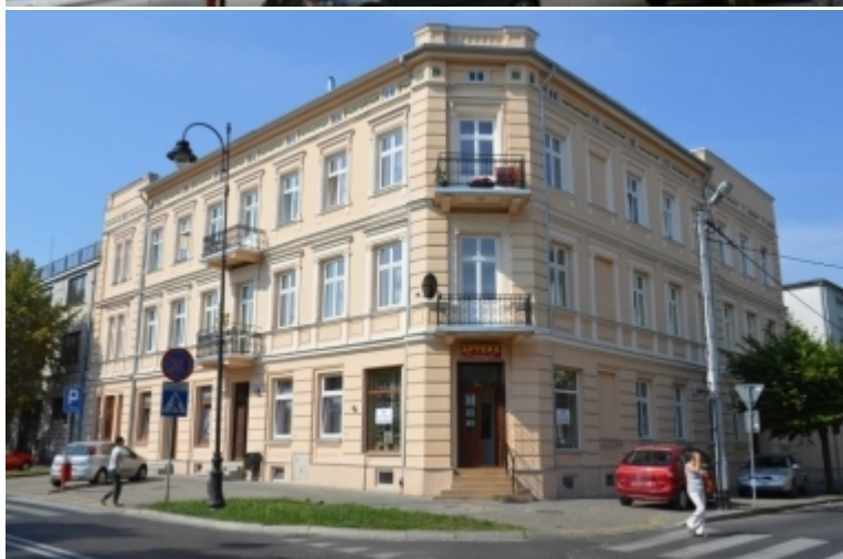
Al. 3 Maja 23