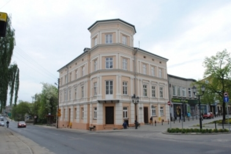
ul. Wojska Polskiego 20